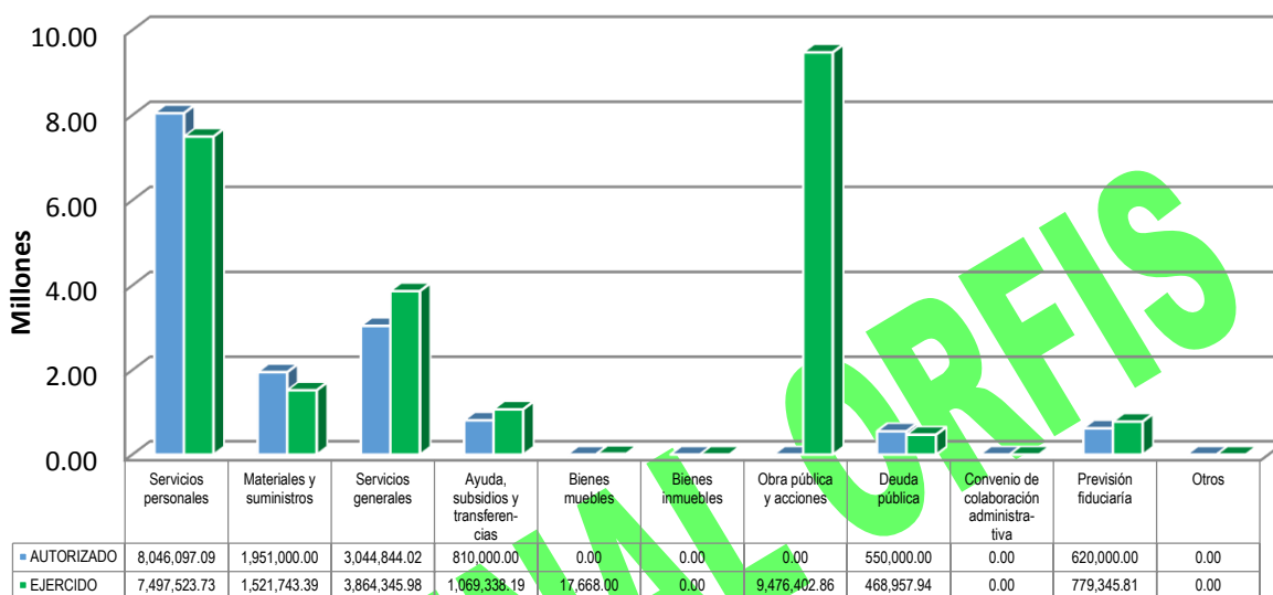
GRÁFICA 2 EGRESOS